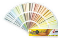
Mazzetta esterni "Impatto"