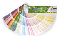
Mazzetta interni "Creativa"