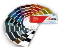
Mazzetta tinte RAL