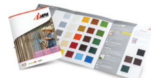
Cartella Advance Colours 2.0